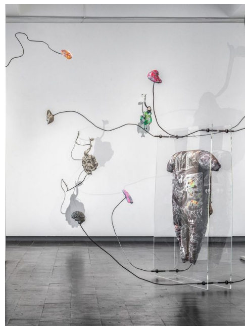
Mariechen Danz Clouded in Veins (dettaglio dell'installazione), 2021

Mariechen Danz (1980, Dublino) ha vinto il GASAG Art Prize 2024, un premio assegnato ogni due anni in collaborazione con la Berlinische Galerie per celebrare artisti che intersecano nella loro pratica: arte, scienza e tecnologia. Le opere di Danz esplorano i modelli di conoscenza umana attraverso installazioni e performance che combinano sistemi scientifici a forme più soggettive. Per la Berlinische Galerie, l'artista ha creato un ambiente complesso con diversi media che riflettono sulla conoscenza come processo dinamico e somatico.