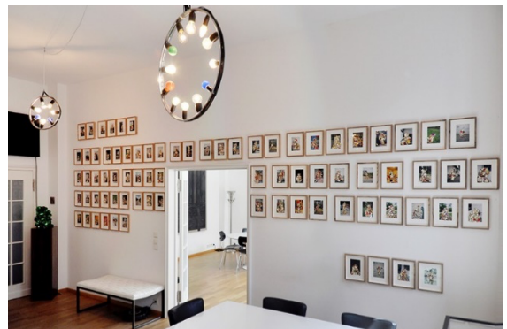
Interno di Wurlitzer Pied à terre

La collezione privata Wurlitzer Pied à Terre comprende opere di artisti emergenti e affermati in una vasta gamma di stili e media. La visita sarà un'esperienza unica in un ambiente intimo e accogliente. La collezione si concentra principalmente sull'arte contemporanea, riflettendo le tendenze e le innovazioni più recenti nel mondo dell'arte. Questo rende Wurlitzer Pied à Terre un luogo ideale per scoprire nuovi talenti e rimanere aggiornati sulle evoluzioni artistiche.