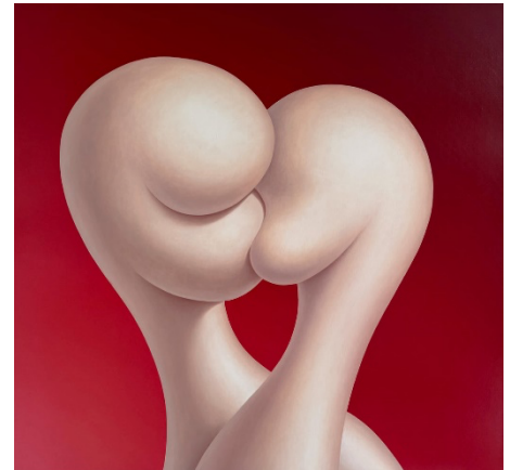
Arjen The Kiss , 2024

Arjen è un artista autodidatta, professore di violino al Conservatorio di Utrecht ma ha continuato a dipingere e disegnare alla ricerca di un proprio linguaggio visivo. Influenzato da Pablo Picasso, Salvador Dalí, le sue opere presentano immagini surreali e spesso assurde, che riflettono una varietà di emozioni e personalità. Arjen esplora i principi fondamentali di diversi stili per integrarli nei suoi lavori, che, pur nati da un'avventura artistica, risultano minimalisti e matematicamente equilibrati.